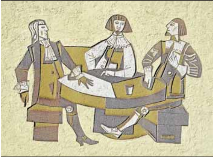
Die drei Fürsten beim Zechen auf dem Dreifürstenstein - der Aufstieg allerdings ist beschwerlich (Sgraffito am Gasthaus Dreifürstenstein in Beuren)