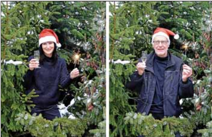
Im rechten Bild hat sich ein Fehler eingeschlichen - finden Sie den Unterschied?

Das Redaktionsteam des Stadtspiegels wünscht allen Leserinnen und Lesern ein frohes Weihnachtsfest, einen guten Rutsch und ein glückliches und gesundes Jahr 2018.