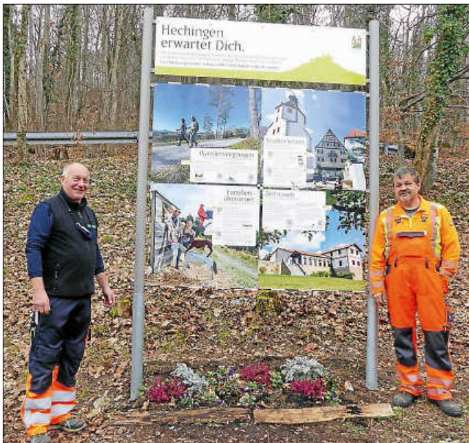
Neu: Die Infotafel auf dem Burgparkplatz wurde jüngst von Mitarbeitern des Betriebshofes installiert.

An einem „Baustein“ dazu wurde jetzt gearbeitet: Die alte, in die Jahre gekommene Informationstafel der Stadt Hechingen am oberen Burgparkplatz, direkt neben dem Kassenhäuschen, wurde jetzt erneuert. Mit großen Bildern und ausgewählten Ausflugstipps, die auch nach einem Burgbesuch zeitlich noch möglich sind, wird nun geworben.