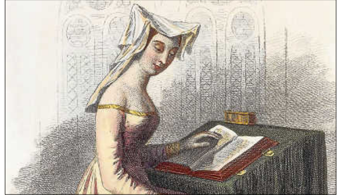
Die Dichterin Christine de Pisan (1364-1430) gilt als erste Feministin.

Die Rolle der Frau in der französischen Geschichte und die Anfänge des Feminismus sind Thema eines vom Partnerschaftskomitee Hechingen - Joué-lès-Tours organisierten Vortrags am Donnerstag, 18. April, 19.00 Uhr, im Hohenzollerischen Landesmuseum. Wir sind daran gewöhnt, die frühere europäische Geschichte und insbesondere das Mittelalter als eine ausschließlich männliche Domäne zu betrachten. Die Idee, dass auch Frauen zu den wichtigen geschichtlichen Akteuren gehören können, erscheint uns relativ neu. Wir verbinden sie mit der feministischen Bewegung des 20. Jahrhunderts.