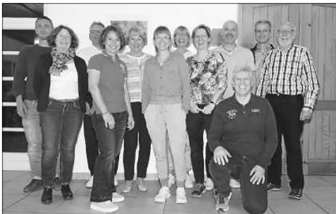
Vorstand und Ausschuss