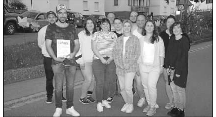
Geehrtes Mitglied des Vereins sowie die Vorstandschaft.

Vorgesehen für das laufende Jahr sind: Kürbisschnitzen im Siegental, Bewirtung zum 1. Mai im Großholz und der Adventszauber.