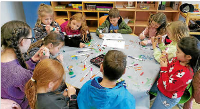
Kreativ und bunt: Ferienbetreuung am Schlossberg.