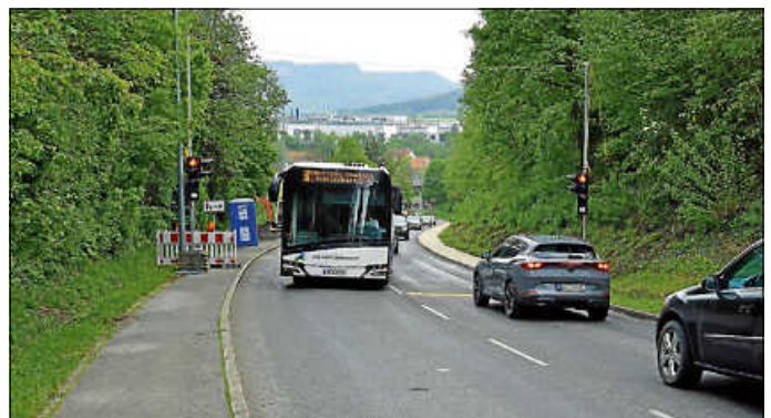
Am „Highway“ lässt die Stadt ein Stützbauwerk sanieren.

Leider: Auch weiterhin wird es im Hechinger Stadtbusverkehr und bei den regionalen Buslinien wegen der Baustellen im Stadtgebiet zu Verzögerungen im Fahrplan kommen. Zwar ist die Vollsperrung am Bahnhof am Wochenende fristgerecht zurückgebaut worden, aber die Vollsperrung der Bisinger Straße und die ampelgeregelte halbseitige Sperrung des „Highways“, also der Stillfriedstraße, sorgen für Verzögerungen im Taktverkehr. Und in der Folge für Beschwerden, die insbesondere an die Hechinger Verkehrsbetriebe Wiest und Schürmann adressiert werden.