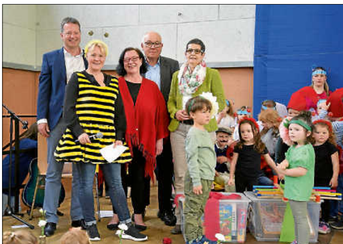
Neue Spielkisten gab es als Geschenk von der Stadt.