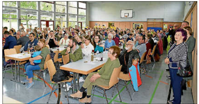
Ganz Stetten feierte mit.