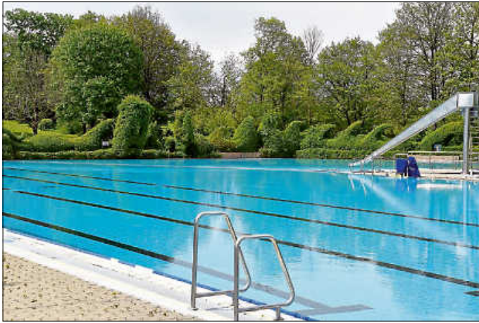
Becken, Sanitäranlagen und der Liegebereich sind für den Freibadbetrieb vorbereitet.

Während der Freibadsaison ist das Hallenbad für den öffentlichen Betrieb geschlossen, es steht aber weiter für den Schul- und Vereinsport zur Verfügung. Die Duschen und Umkleidekabinen im Inneren des Bades stehen allen Badegästen, also auch den Freibadbesuchern, zur Verfügung. Im Betrieb ist während der Freibadsaison zudem das Warmwasserußenbecken, das auf 26 °C aufgeheizt wird.