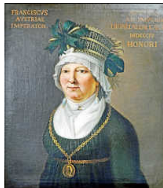
Madame Kaulla, Ölgemälde im Besitz des Hohenzollerischen Landesmuseums.