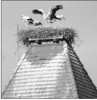
Wir wünschen Ihnen einen schönen Urlaub!

Die Schulferien haben begonnen und damit auch für viele von Ihnen die Zeit der Erholung. Wir wünschen Ihnen einen schönen Urlaub, das Wetter, die Ruhe und den Fun-Faktor, den Sie sich wünschen. Kurz: Erholen Sie sich gut!