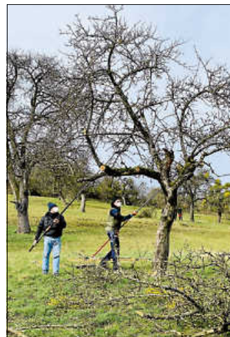
Ein Tag für Weilheim – Gemeinsam für unsere Obstwiesen.