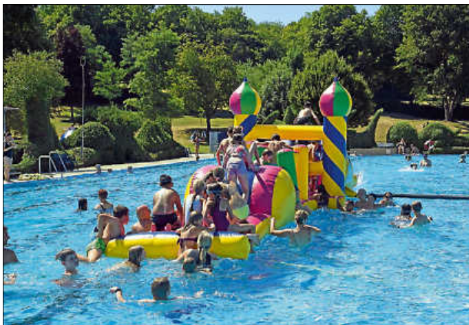
Die Aladin-Rutsche wird im Hallenbad zu Wasser gelassen

Spiel und Spaß im Hechinger Hallenbad: Am Samstag, 15. März 2025, wird von 14.00 bis 17.00 Uhr die aufblasbare Aladin-Rutsche zu Wasser gelassen. Kinder und Jugendliche, die dort rutschen oder springen wollen, sollten im Schwimmen geübt sein. Während der Spielzeit ist das Becken für Bahnschwimmer gesperrt.