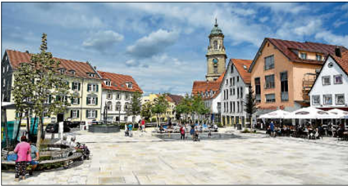
Am 10. April findet der Georgimarkt auf dem Obertorplatz statt.

Erstmals wird der Georgimarkt am Donnerstag, 10. April, auf dem Obertorplatz stattfinden. Von 8.00 bis 18.00 Uhr werden dort zehn Marktstände aufziehen. Darunter ein Messerschleifer und Händler mit Strickmode, Socken, Kurzwaren, Haushaltswaren sowie weiteren einschlägigen Krämermarkt-Angeboten. Mit dabei sind zudem ein Imbiss, ein Süßwarenstand und ein Crêpes-Stand.