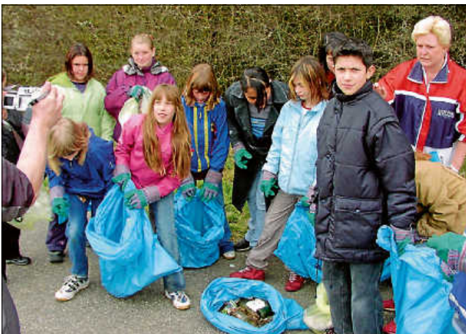
Die Stadtputzete gibt es schon sehr lange. Wer erkennt sich auf dem Bild aus dem Jahr 2004? Die Schüler sammelten entlang des Sträßchens vom Eisweiher zum Lindich.

Der alljährliche „Aktionstag Saubere Stadt“ ist dieses Jahr zu „Aktionswochen“ ausgeweitet worden. Wegen des späten Osterferien-Termins fand sich kein gemeinsamer Termin und die teilnehmenden Schüler und Schülerinnen der Hechinger Schulen werden in den kommenden zwei Wochen an verschiedenen Tagen Müll zusammenklauben, der – leider – innerhalb der Kernstadt und Stadtteile sowie der einschlägigen Freizeitorte im Außenbereich zu finden ist.