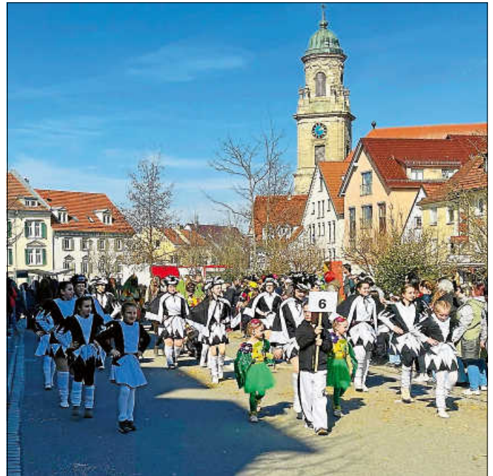
Die Tanzgarde Weilheim