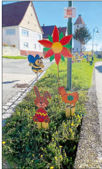
Die bunte Osterwiese