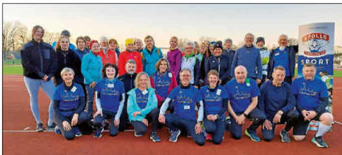
Der Startschuss zu „Hechingen läuft“ ist erfolgt.

Das erste richtige Training fand am Dienstag, den 1. April um 18 Uhr im Weiherstadion statt. Trainiert wird grundsätzlich bei jedem Wetter und natürlich auch in den Ferien! Wer Lust hat, noch einzusteigen, kann sich noch anmelden.