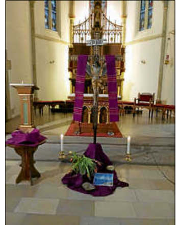
Kreuzwegandacht in St. Dionysius

Am Sonntag, den 16.3.2025 um 17.00 Uhr wurde in der St. Dionysiuskirche in Schlatt eine Kreuzwegandacht gehalten. Die 14 Stationen wurden abwechselnd in deutscher und polnischer Sprache gebetet, ebenso ein italienisches Kreuzweggebet. Nach der 12. Station (Jesu Tod am Kreuz) bestand Gelegenheit zur Kreuzverehrung mit Blumen. Die Gläubigen beteten gemeinsam in verschiedenen Sprachen, im Besonderen für den Frieden in den vielen Kriegsgebieten unserer Zeit und Tage. Pater Matthias von den Weißen Vätern spendete den Abschlusssegen in deutscher, polnischer und italienischer Sprache.