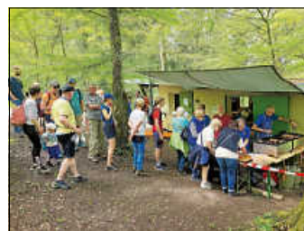
Bewirtung an der Skihütte