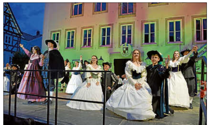
Tänzer und Tänzerinnen gesucht!