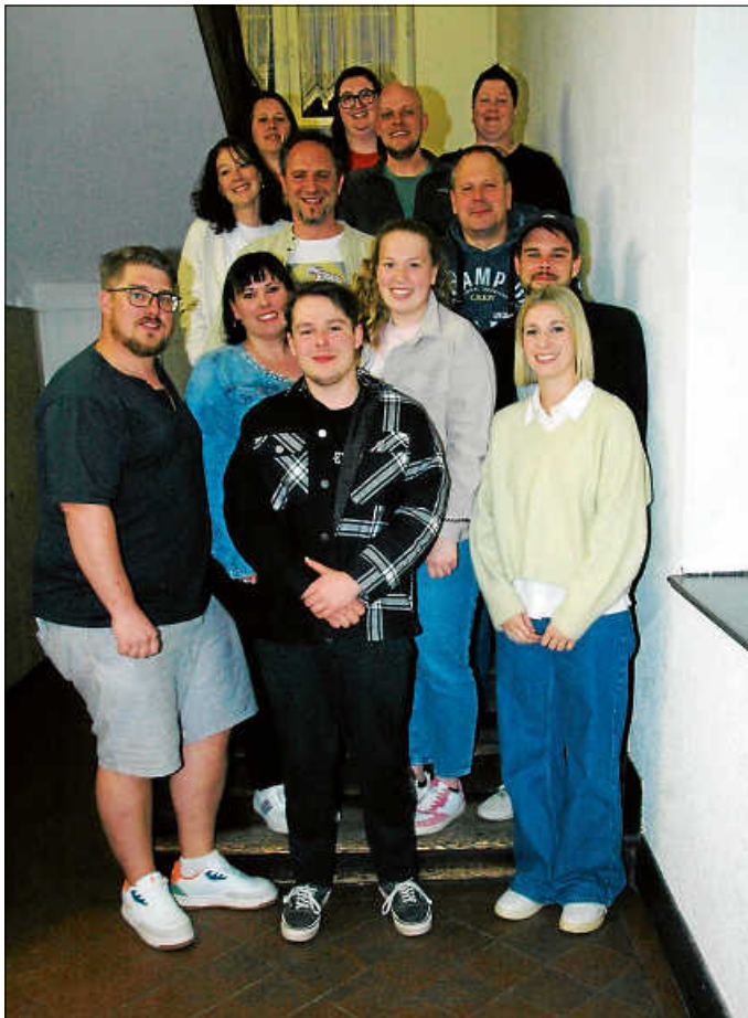
Ausgeschiedene und aktive Vorstandschaftsmitglieder der Narrenvereinigung