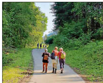
Wandern mit Köpfchen

Samstag, 26.04.2025, von 9:30 bis 13:00 Uhr Treffpunkt wird bei Anmeldung bekannt gegeben.