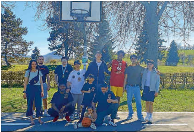
Das gute Frühlingwetter ausgenutzt hat das Hechinger Streetwork-Team mit den Jugendlichen.

liche Vorhaben in der Lichtenauhalle wurde kurzerhand bei dem guten Frühlingwetter nach draußen verschoben. Von 13.00 bis 17.00 Uhr fand ein offener Basketballworkshop statt, in Kooperation mit dem Verein On fire BBC Albstadt.