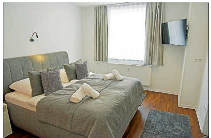
Geräumig und hell sind die Gästezimmer.

Bedenken, das Hotel könnte nicht ausgelastet sein, gibt es nicht – die Sahins, die aus Antakya in der Türkei stammen, führen das Haus ganz im Sinne des dortigen Verständnisses von Gastfreundschaft. Dem Gast einen Wunsch zu erfüllen, ist eine Selbstverständlichkeit. Die Sahins und ihre Mitarbeiter sind für die Gäste jederzeit ansprechbar, auch wenn das moderne Hotel automatisch funktioniert. Mit Code und Schlüsseldepot zum Beispiel für Spätkömmlinge. Zwar gibt es kein Restaurant mehr, wie im Mohren, aber wenn Gäste hungrig sind, vermitteln die Sahins gerne einen Lieferservice. Und wenn notwendig, hat Yesim Sahin auch einen leckeren Imbiss parat.