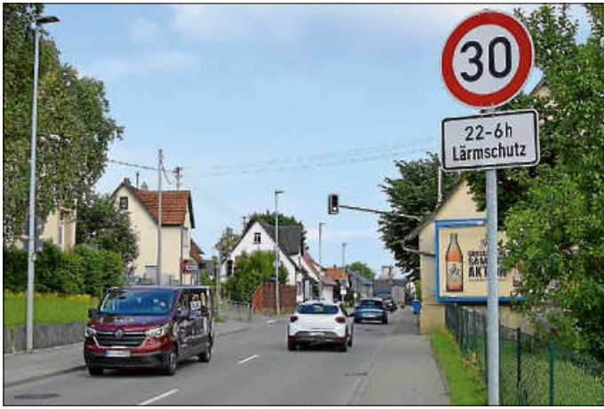
Aktuell gilt 30 km/h in der Nacht, zukünftig im Bereich des Kindergartens und der Bushaltestellen rund um die Uhr.

Insgesamt also ein Streckenabschnitt, in dem unter anderem viele Kinder bzw. Schüler zu Fuß unterwegs sind. Und die B 32 ist generell eine stark frequentierte Straße, die noch stärker befahren ist, wenn, wie zurzeit wegen der Tunnelvollsperrung in Laufen, die Parallelstrecke über Albstadt erschwert ist.