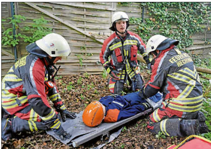
Gott sei Dank: Die Retter sind vor Ort.

Schnelligkeit bei der Personenrettung ist gefragt, gleichzeitig muss der Brand gelöscht werden. Ruckzuck zur Stelle ist die Abteilung Stein, 1.000 Liter Löschwasser hat deren Fahrzeug an Bord. Umgehend wird zudem der Unterflurhydrant auf der Straße an die Pumpe des Fahrzeugs angeschlossen. Zur Brandbekämpfung in dem völlig verrauchten Gebäude rücken Atemschutzträger vor, erste Verletzte werden abtransportiert und vom Roten Kreuz in Empfang genommen. Die mittlerweile aus der Ermelesstraße angerückte Drehleiter verhindert derweil, dass die Flammen auf das benachbarte Verwaltungsgebäude übergreifen.