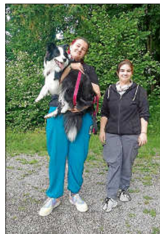
Chilli braucht mal Pause