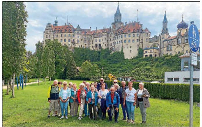
Vor dem Hohenzollernschloss

Im Café Schön, bei Kaffee und Kuchen oder Eis, war dann der Abschluss und gegen Abend ging es, wieder mit dem Zug, nach Schlatt zurück. Es war ein schöner, gemütlicher, geselliger Ausflugstag.