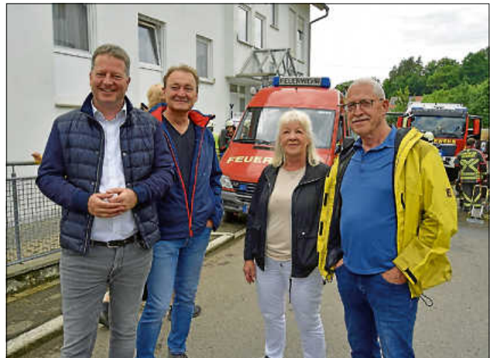
Wissen um den Wert der Wehr: Bürgermeister und Ortsvorsteher

Schlussendlich konnte die Wehr vermelden: Der Brand ist gelöscht, die Verletzten bzw. Vermissten sind gerettet. Damit ist die Arbeit der Feuerwehrleute noch lange nicht getan. Das Gebäude muss enträuchert werden, ein Trupp prüft, ob tatsächlich alle Verletzten gefunden wurden. Die Schläuche müssen wieder aufgerollt werden, für die persönliche Hygiene der Feuerwehrleute steht eine mobile Waschgelegenheit zur Verfügung, die geplagten Atemschutzträger können endlich verschlafen.