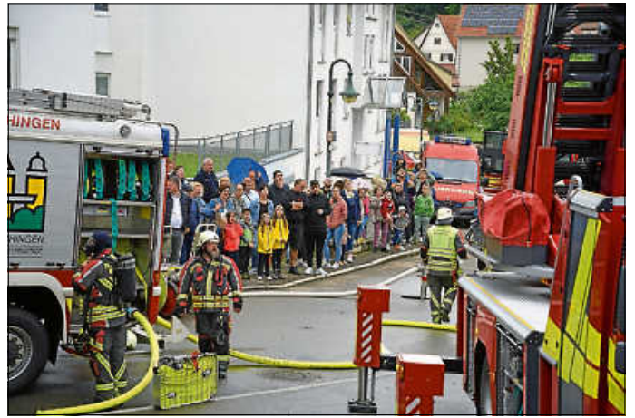
Zahlreiche Zuschauer verfolgten die Übung