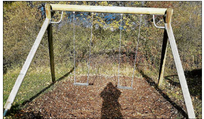
Neue Schaukel am Waldspielplatz.

Ab sofort kann auf dem Waldspielplatz wieder kräftig und sicher auf der neu angebrachten Schaukel geschaukelt werden.