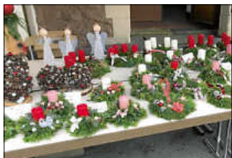
Selbstgemachte Kranze und Gestecke

Auch für das leibliche Wohl mit Kaffee, Kuchen und Getränken ist gesorgt. Freuen Sie sich auf einen gemütlichen Nachmittag mit guten Gesprächen und lassen Sie sich auf die Adventszeit einstimmen.