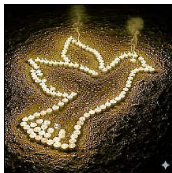
Beispiel für eine Friedenstaube aus Kerzen

Am Donnerstag, den 13.11.2025 von 17.00 - 19.00 Uhr findet auf dem Marktplatz vor dem Rathaus die diesjährige „Eine Million Sterne Aktion“ in Hechingen statt.