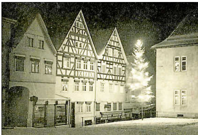
Rathausvorplatz und Rain bei Nacht. Die Rathausfassade zeigt den 1935 hergestellten Zustand, das Foto ist also zwischen 1935 und dem Abriss des alten Rathauses 1956 entstanden.