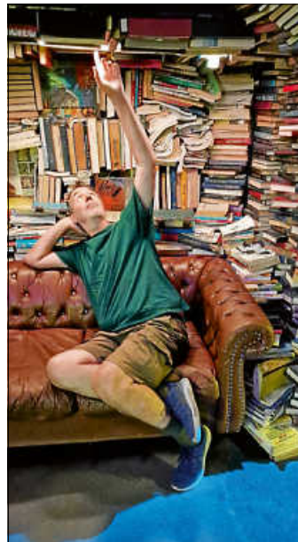
Autor Boris Pfeiffer.