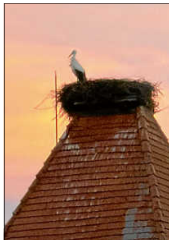
Storch bei aufgehender Sonne am 1. November 2025.

Am 7. Februar 2025 wurde das Storchmännchen BSYT erstmals in diesem Jahr in Weilheim beobachtet – konkret zwischen 16.30 und 16.45 Uhr. Zur großen Freude aller Weilheimer kehrte am 20. Februar auch das Weibchen zurück.