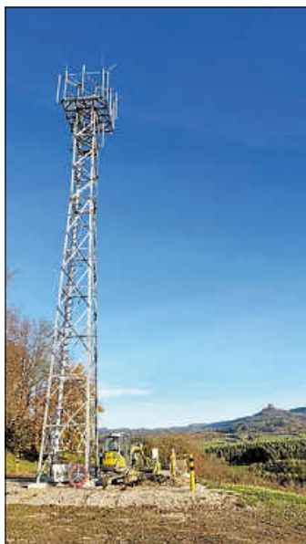
Mobilfunkmast auf dem Bleichberg

Gute Nachrichten für die Einwohnerinnen und Einwohner in Weilheim: Der Glasfaserausbau der NetCom BW geht auf die Zielgerade. Das wurde in der jüngsten Sitzung des Ortschaftsrats am Donnerstagabend bekanntgegeben. Neben dem Thema Breitband informierte der Ortsvorsteher über den Stand beim Mobilfunkmast auf dem Bleichberg, die Haushaltslage sowie den bevorstehenden Winterdienst.