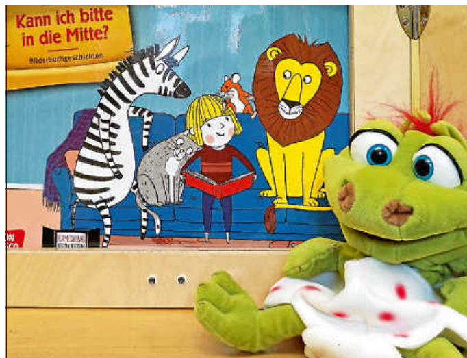
Kann ich bitte in die Mitte? - Kamishibai-Theater in der Stadtbücherei