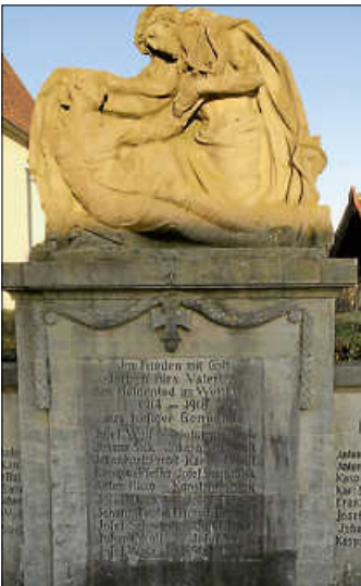
Ehrenmal in Weilheim.

Zum Volkstrauertag gedenken wir der Opfer aus Kriegen und Gewaltherrschaft aller Nationen. Ich darf Sie zum Gedenkgottesdienst am kommenden Dienstag, 18. November, 18.30 Uhr in der Kirche St. Marien mit Ansprache zum Volkstrauertag einladen. Im Anschluss wird der Kranz am Denkmal niedergelegt.