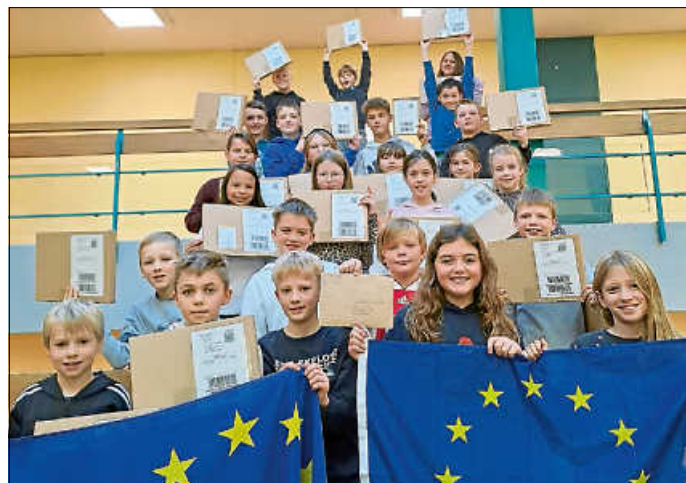
Weihnachtsschmuck für ganz Europa.

Im Gegenzug trafen in den vergangenen Wochen Päckchen mit Weihnachtsbaumschmuck aus allen Ecken Europas in Hechingen ein. Die Vorfreude der Klasse war riesig, als sie die sorgfältig verpackten Dekorationen auspacken durfte. Nun schmückt ein wahrhaft internationaler Baum die Pausenhalle. Er steht symbolisch für Frieden, Freundschaft und die gemeinsamen Werte in Europa – eine Botschaft, die in der heutigen Zeit wertvoller denn je ist. Die Klasse 5d hat nicht nur Weihnachtskugeln gebastelt, sondern auch Brücken geschlagen.