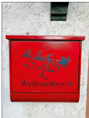
Roter Briefkasten am Weilheimer Rathaus, neben dem großen Weihnachtsbaum.