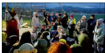
Nikolaus am Sportheim

Trotz des mäßigen Wetters machten sich letzten Sonntag viele Kinder gemeinsam mit ihren Eltern auf den Weg, um den Nikolaus zu finden. Auf dem Weg zum Sportheim war es schließlich so weit: Der Nikolaus wurde entdeckt! Gemeinsam mit den Kindern sang er