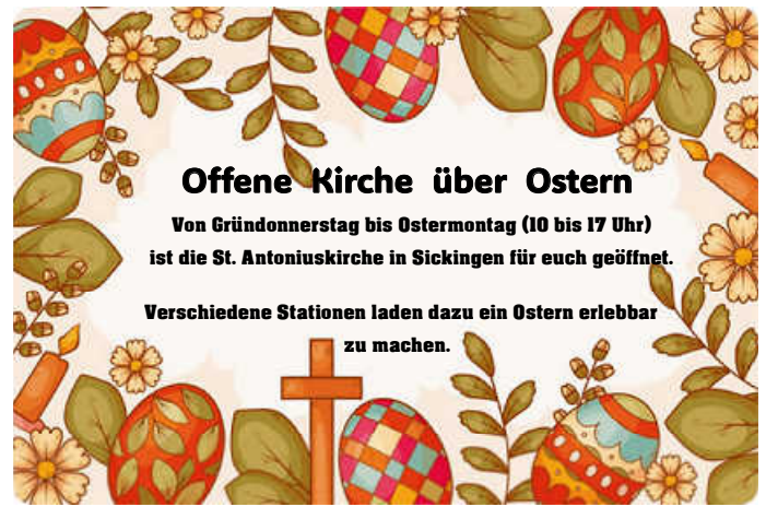
Eine Aktion des ökumenischen Kinderkirchteams Sickingen.

Von Gründonnerstag bis Ostermontag (10-17 Uhr) ist die St. Antoniuskirche in Sickingen für Euch geöffnet. Verschiedene Stationen laden dazu ein, Ostern erlebbar zu machen.