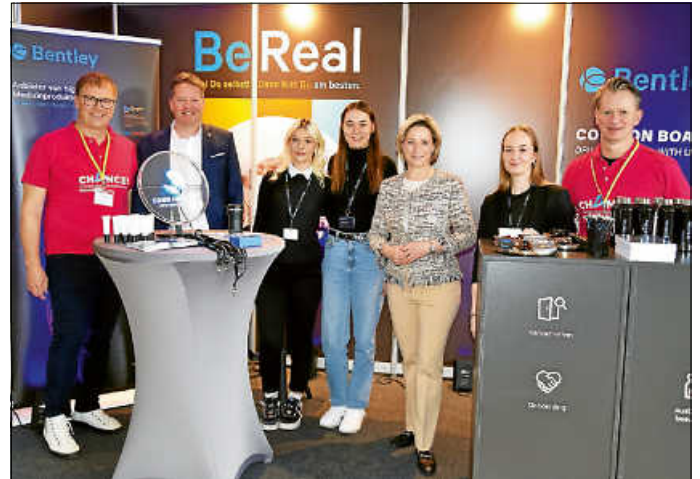
Die Firma Bentley bietet Ausbildungsplätze...