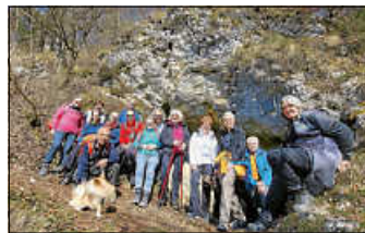
Ski-Club Hechingen e.V. - wanderer im Donautal