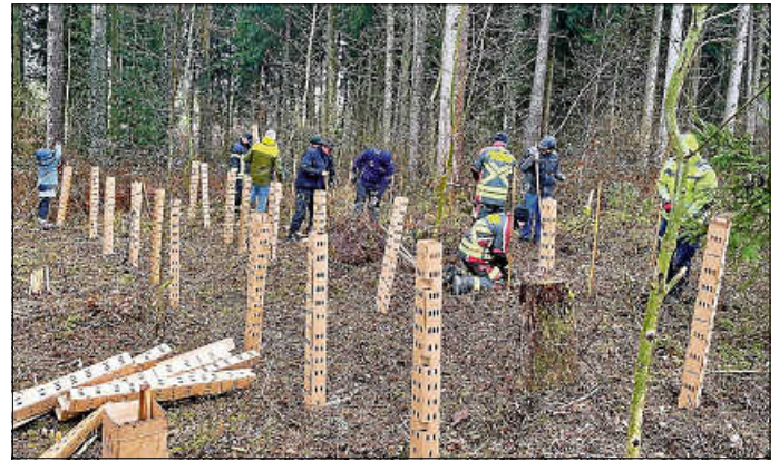
Pflanzaktion im Fichtenwald

Ziel hierbei ist es, einen Mischwald zu erzeugen, der den aktuellen Einflüssen der Natur standhalten soll. Im Anschluss an die Pflanzaktion konnten sich die tatkräftigen Helfer bei einem Vesper und Getränken stärken.