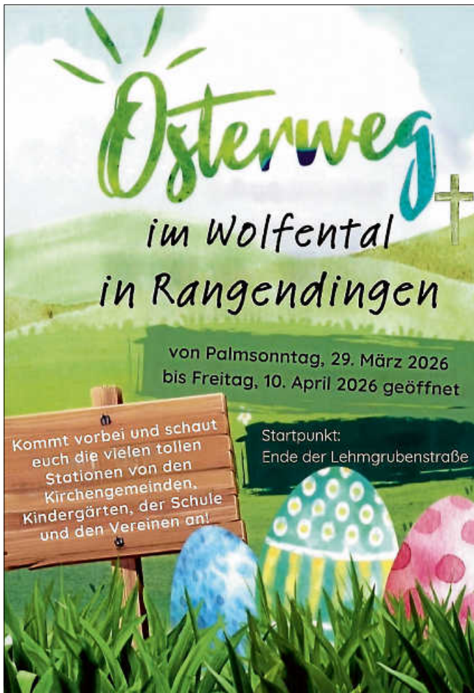
Plakat: SE Hechingen