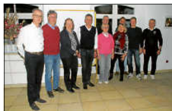
Ski-Club Hechingen e.V.: Vereinsvorstand und anwesende geehrte Mitglieder