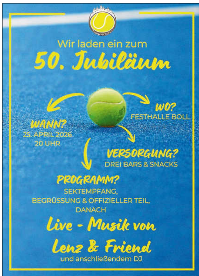
Plakat: TC Boll