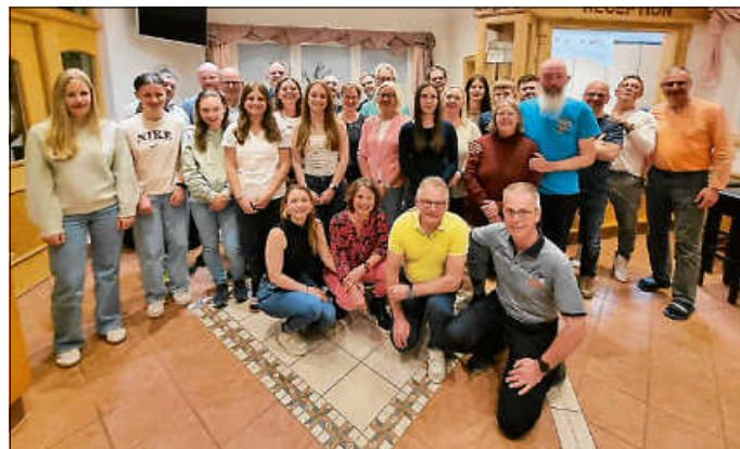
Ski-Club Hechingen Saisonabschluss - Gruppenbild

Aprés Ski am Samstag kann man von einem rundum gelungenen Wochenende sprechen. So ging es am Sonntagnachmittag sehr zufrieden wieder nach Hause. Wie schon 2025 waren die beiden 2 Tage noch einmal maßgeschneidert, um den Winter zu verabschieden. Die Planung 2027 ist schon im Gange.