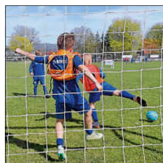
Unbeschwerte „Bolzplatz-Zeit“ für die Kinder