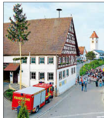
Freiwillige Feuerwehr Weilheim lädt herzlich zum traditionellen Maibaumstellen.

Am Donnerstag, 30. April, wird am Rathaus wieder das Aufstellen des festlich geschmückten Maibaums gefeiert.