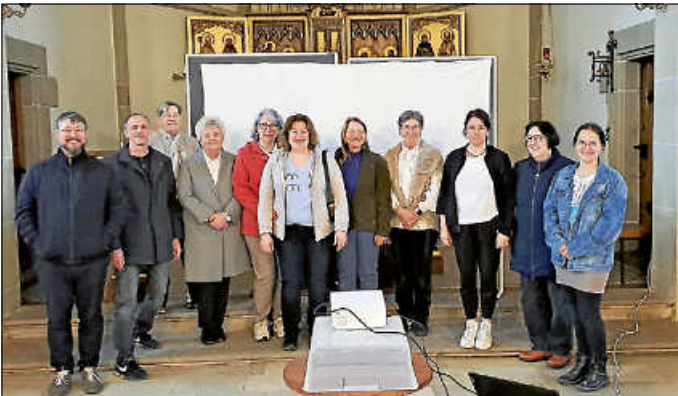
Neues Gemeindeteam Schlatt/ Beuren