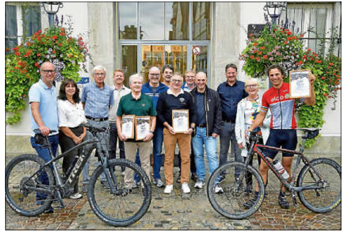
Siegerehrung 2025: Die fleißigsten Hechinger Stadtradeln wurden von der Stadt Hechingen geehrt.

Im Rahmen der Initiative Radkultur fördert das Land die Teilnahme an der Aktion des Klima-Bündnisses. Das Ziel: In Teams drei Wochen lang möglichst viel Fahrrad fahren und Kilometer sammeln – egal ob auf dem Weg zur Arbeit, zur Schule, zum Einkaufen oder in der Freizeit. Mitradeln lohnt sich gleich dreifach: Wer für ein gemeinsames Ziel in die Pedale tritt, stärkt sowohl die Gemeinschaft als auch die eigene Gesundheit und schont dabei das Klima. Der Wettbewerb ist spannend: Ob Unternehmen oder Schule, Verwaltung oder Sportverein – Radfahrer können Unterteams etwa für verschiedene Abteilungen oder Schulklassen gründen und innerhalb des Hauptteams gegeneinander antreten.