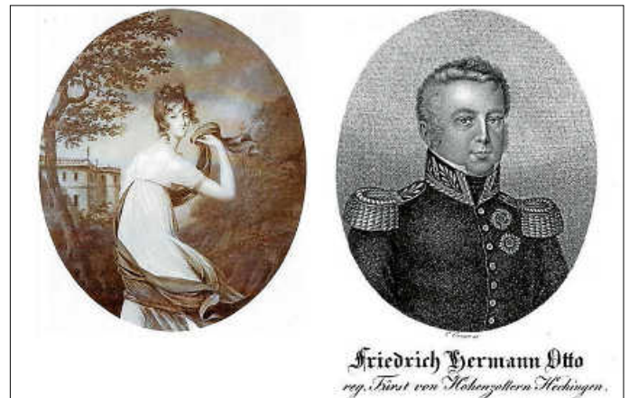
Eine der „Liebesgeschichten“, die allerdings wenig harmonisch war: Fürst Friedrich Hermann Otto von Hohenzollern-Hechingen und Pauline Biron von Sagan und Kurland, die Eltern des letzten Fürsten, Friedrich Wilhelm Constantin.

Liebe ist das Licht unserer Existenz. Deshalb hört der Tourist in verschiedensten Städten und Ländern der Welt schöne Liebeslegenden, die im Zusammenhang mit den entsprechenden Orten stehen. Nicht aber in Hechingen! In dieser Führung werden keine Legende erzählt, sondern gesicherte, urkundlich bestätigte historische Fakten. Dennoch bilden diese Fakten dramatische Geschichten, die in ihrer emotionalen Spannung uns ein Spiel von menschlichen Gefühlen in deren ganzem Spektrum von Glück bis Verzweiflung zeigen.