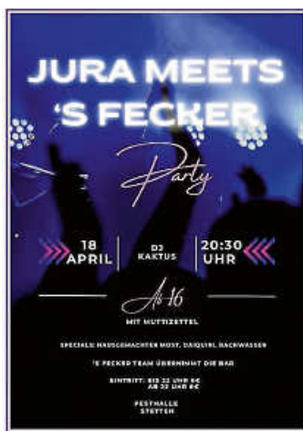
Plakate: Jugendverein Stetten e.V.