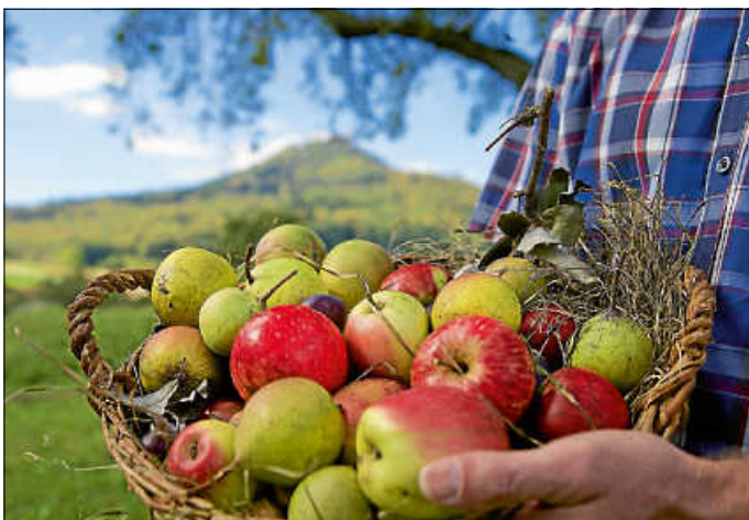
Am Sonntag, 26. April, findet der Streuobsttag an der Breite statt.

Geballte und kompetente Informationen zum für das Albvorland typischen Streuobstbau, ergänzt durch Führungen, Kinderunterhaltung und Speis' und Trank, das alles bietet der 4. Hechinger Streuobsttag am Sonntag, 26. April 2026, von 11.00 bis 17.00 Uhr. Dieser findet auf den Obstwiesen „An der Breite“ statt, gegenüber