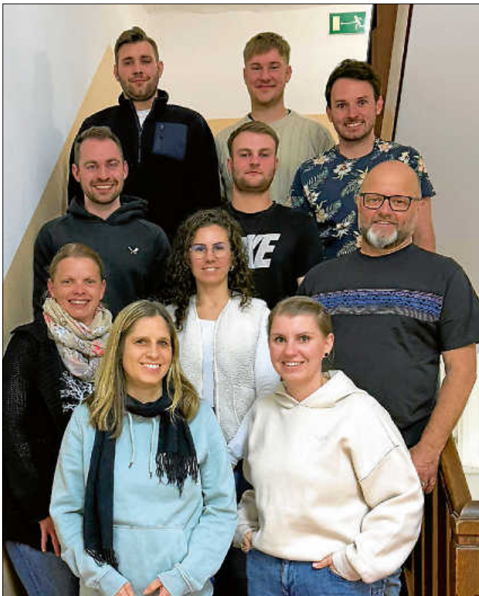
Vorstandschafft des Musikvereins Schlatt