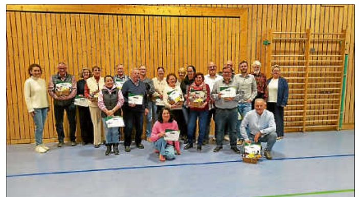
Die Geehrten Mitglieder mit der Vorstandschaft der SSG Bechtoldsweiler e. V.

Wie immer folgte danach ein gemütliches Beisammensein zum Abschluss der Versammlung.