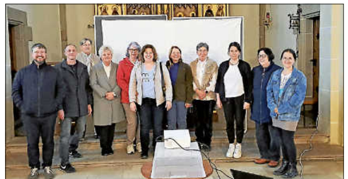
Das neue Gemeindeteam Schlatt/Beuren