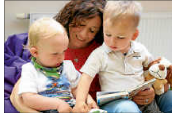
Bilderbuchzeit bei der Tagesmutter.

Die Kindertagespflege ist ein familiennahes Angebot, bei dem Ihr Kind in den privaten Räumen oder in anderen geeigneten Räumen von einer qualifizierten Tagesmutter bzw. einem Tagesvater Ihrer Wahl betreut wird. Als zertifizierter Bildungsträger ist der Jugendförderverein Zollernalbkreis e. V. vom Landkreis mit der umfassenden fachlichen Qualifizierung der Kindertagespflegepersonen beauftragt. Die Teilnahme an der Grundqualifizierung sowie an weiteren jährlichen Fortbildungen ist eine der Voraussetzungen, um als Tagesmutter oder Tagesvater eine Pflegelaubnis durch das Jugendamt zu erhalten.