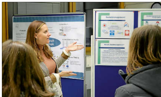
Am 6. Februar ist am BSZ Hechingen Berufsinformationstag

Hechingen. Am Freitag, den 6. Februar öffnen die beruflichen Schulen im Zollernalbkreis ihre Pforten, um über ihr vielfältiges Bildungsangebot zu informieren. Mit dabei ist natürlich auch das Berufliche Schulzentrum Hechingen (BSZ), das seine vielfältigen Karrierechancen vorstellt. Der Berufsinformationstag des BSZ findet am unteren Gebäude im Neubau am Schlossberg statt. Das Angebot am Vormittag richtet sich vor allem an Schülerinnen und Schüler der Klassen 8, 9 und 10. Sie haben die Chance, das BSZ aus nächster Nähe kennenzulernen und Einblicke in die unterschiedlichen Profile zu erhalten. Ab Mittag gilt dies auch für Eltern und deren Kinder.