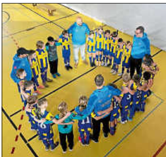
Fototermin unserer E-Jugend

Am vergangenen Samstag stand für unsere E-Jugend ein ganz besonderer Termin auf dem Programm.