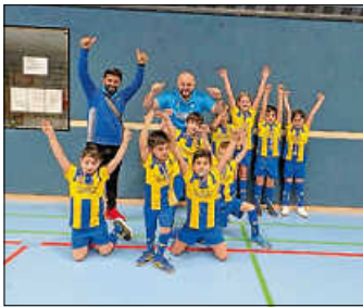
Hallenspieltag Trossingen

Am vergangenen Sonntag nahm unsere F-Jugend am zweiten Hallenspieltag in Trossingen teil.