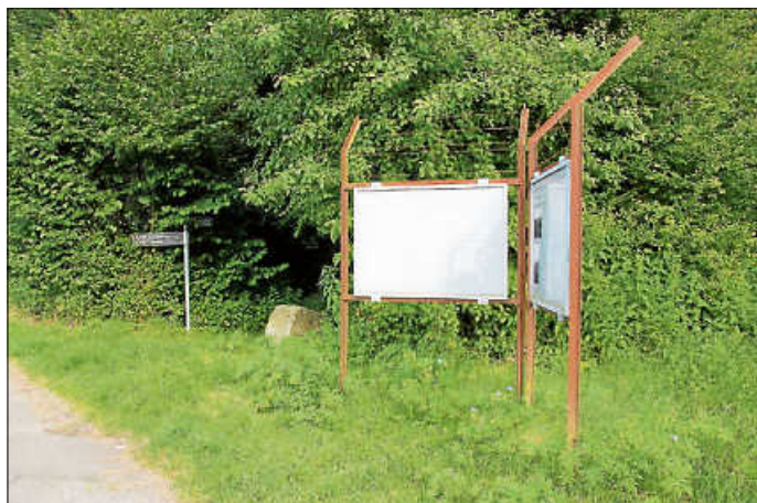
Infotafeln am Lehrpfad

Die Veranstalter sehen den Besuch im Zusammenhang mit der Auseinandersetzung mit dem Thema Rechtsextremismus und den rechten Bestrebungen, die NS-Zeit zu verharmlosen. Der „Vogelschiss“ vor unserer Haustür bedeutete für über Tausend Bisinger Häftlinge die Vernichtung durch Arbeit in dem irrwitzigen „Unternehmen Wüste“. Ein Projekt des NS-Rüstungsministeriums, in dem KZ-Häftlinge unter unmenschlichen Bedingungen Ölschiefer zur Treibstoffgewinnung abbauen mussten.