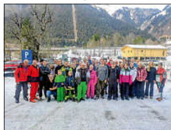
Gruppenbild Wintersportler Sonnenkopf

Am 17. Januar startete ein Bus mit 44 Wintersportbegeisterten ins idyllische Skigebiet Sonnenkopf am Fuße des Arlbergs. Das Naturschneegebiet bot gut präparierte Pisten in optimaler Höhenlage. Blauer Himmel und Sonne satt rundeten den perfekten Skitag ab. Beim Ski-Club gehts weiter im Winterprogramm: