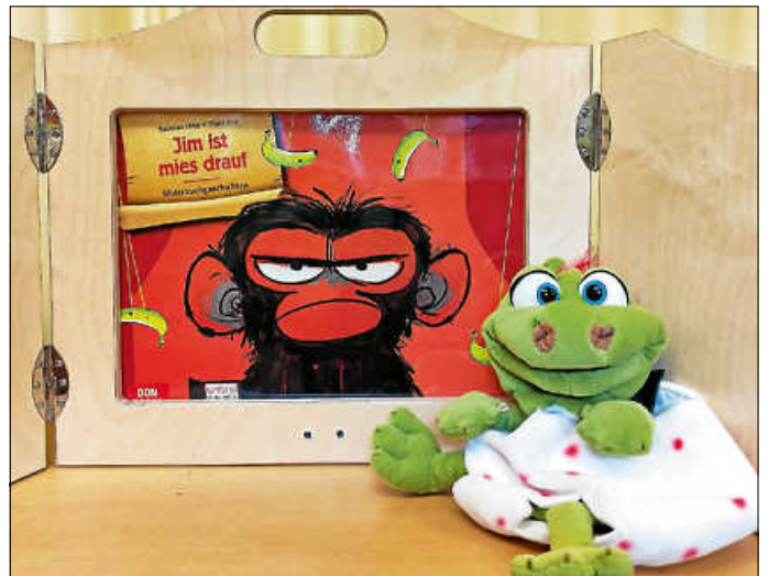
Jim ist mies drauf, Drache Gregor hat gute Laune.

Die Sonne ist zu hell, der Himmel zu blau und die Bananen zu süß: Der kleine Affe Jim Panse hat heute an allem etwas auszusetzen. Ob es an seiner schlechten Laune liegt, wie sein Freund Nick vermutet? Sicher nicht! Schließlich ist Jim überhaupt nicht übel drauf und mürrisch ist er schon gar nicht!